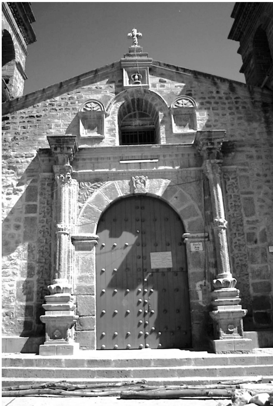
Ilustración N° 2. (Foto Raúl Mancilla, 2018).