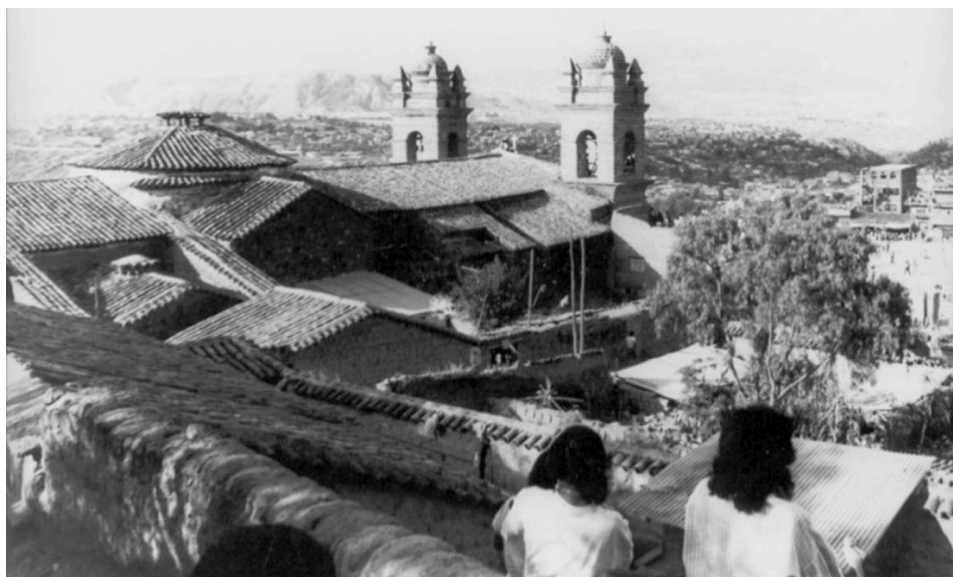
Ilustración N° 4. (Foto Raúl Mancilla 1987).

La volumetría externa de la iglesia presenta una cubierta de teja de arcilla a dos aguas y con un juego de desniveles, reluciendo la cúpula con remate de una linterna como en las sacristías. El perímetro externo de la nave debió estar reforzada por contrafuertes, sin embargo, el único que prevalece está próximo a la torre del evangelio, ver (ilustración 4).