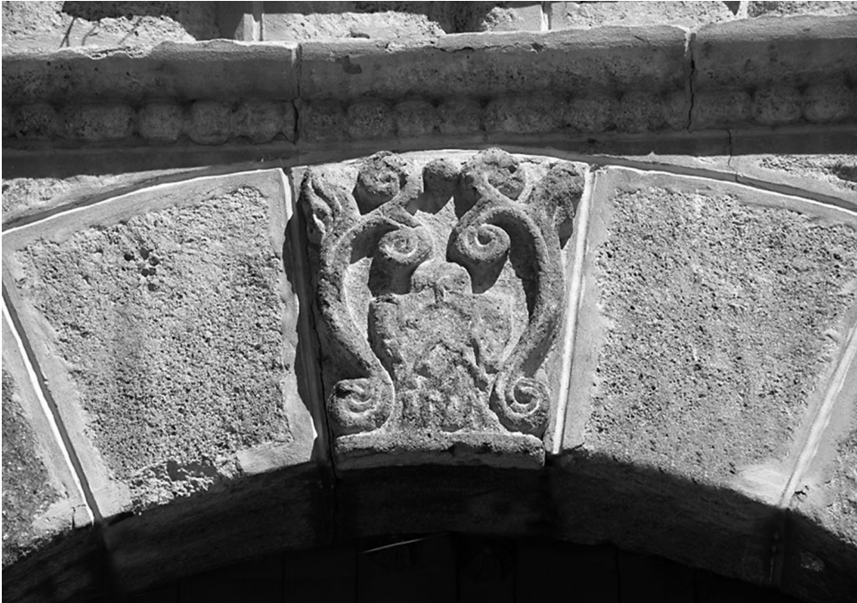
Ilustración N° 3. (Foto Raúl Mancilla, año 2019).

Las torres: A los pies de la iglesia se sitúa las torres, compuestas estructuralmente por basamento, cuerpo y campanario. Los basamentos canteados estrán reforzados por banquetas de piedras de campo. Los cuerpos presentan la misma altura y el mismo ancho. En el segundo cuerpo prevalecen campanarios con el remate de una cruz apoyada sobre un tambor cilíndrico y la media naranjilla, alzados sobre el cuerpo de los vanos y rodeado por cuatro pináculos. (Ilustraciones 1). En los vanos de los campanarios se distinguen balaustradas de cemento, a semejanza del campanario de la iglesia de San Francisco de Asís y la Compañía de Jesús de Ayacucho. Las torres fueron realizados en concordancia a la conformación específica de la escuela de las torres ayacuchanas.