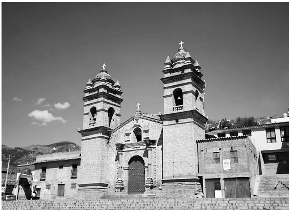
Ilustración N° 1. (Foto Raúl Mancilla, año 2018).

medio punto, jambas lisas con impostas, flanqueado por columnas estriadas y roleos. Los basamentos de las columnas descansan en plintos de base cuadrangular, sobre ellas cubos con decoraciones de flores en sus paneles. En la parte superior del cubo, destacan cornisas superpuestas. En la base del fuste, sobresale vegetales de hojas escultóricas, seguido por un cilindro corto y trunco, del cual nace el fuste y en la parte media se exhiben igualmente, hojas pequeñas y finalmente culminan en capiteles corintios o compuestos (ver Ilustración 2).