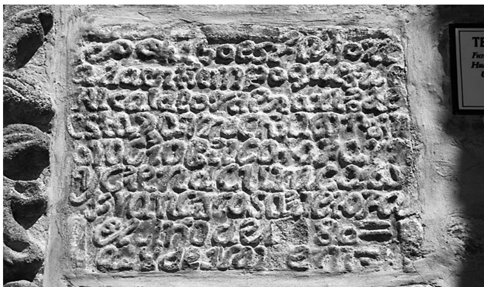
Ilustración N° 5.

Se hizo esta portada en tiempo del Alcalde ordinario de esta parrochia (?) ambrocio pilco y ciendo cura don francisco sag reroro (?) el año de 1...8 o = y devalde = (Ilustración N° 5).