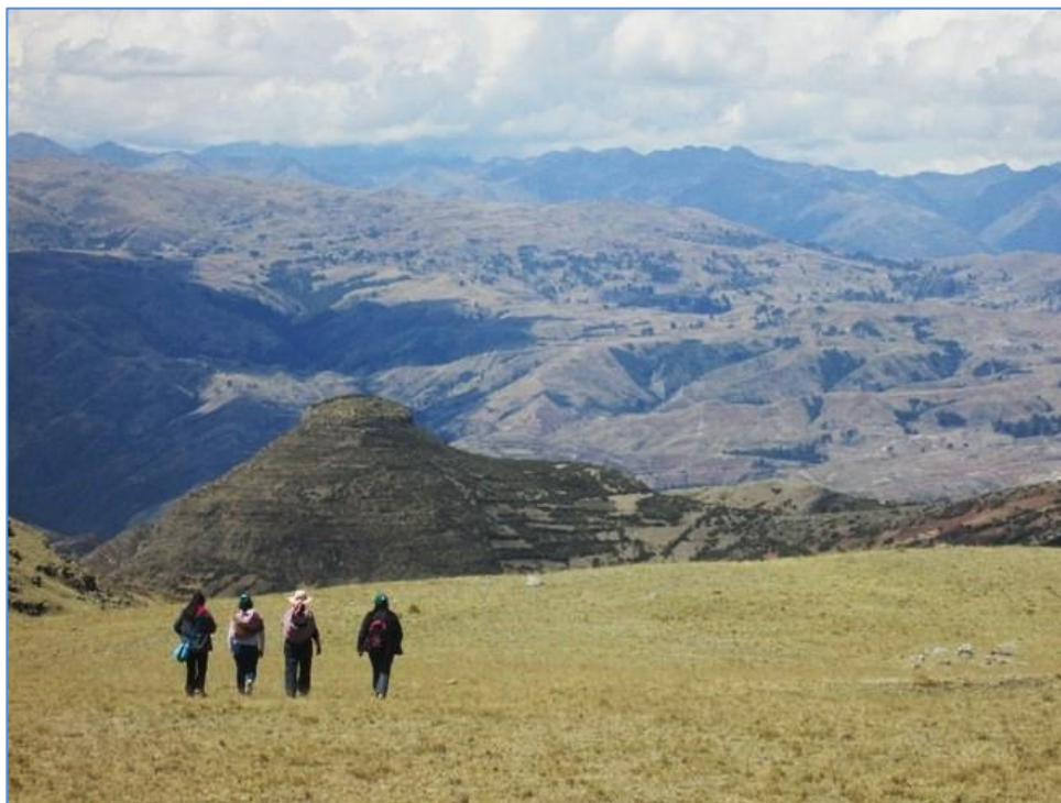
Ilustración 1: Colina donde se levanta Willka Marca (Raúl Quincho, 2014).

Región natural. Se encuentra ubicado en la región natural de suní , en los declives orientales occidentales de los Andes Centrales en la provincia de Angaráes.